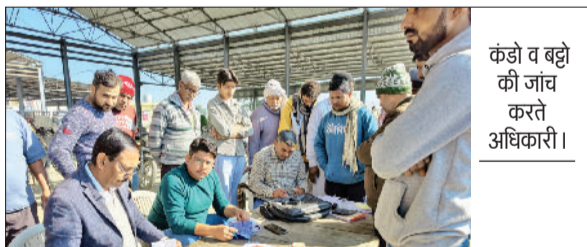
कंडे व बट्टे की जांच करते अधिकारी।