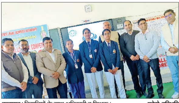
कलायत। विद्यार्थियों के साथ अधिकारी व शिक्षक।