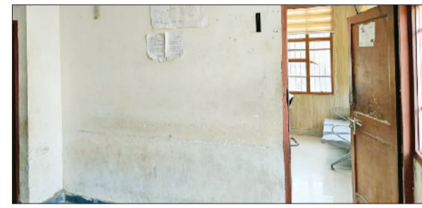
जींद। खाली पड़ा तहसीलदार कक्ष।