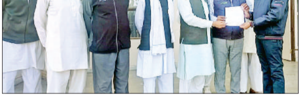
जुलाना। एसडीएम को ज्ञापन सौंपते पूर्व सैनिक।

■ गणतंत्र और स्वतंत्रता दिवस पर निमंत्रण देने की रखी मांग