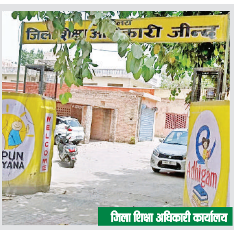
जिला शिक्षा अधिकारी कार्यालय

प्रथम वार्षिक परीक्षा व द्वितीय वार्षिक परीक्षा को संयुक्त रूप से एक ही परीक्षा माना जाएगा है। इसलिए द्वितीय वार्षिक परीक्षा में प्रविष्ट होने वाले सभी परीक्षार्थियों को आंशिक अंक सुधार व पूर्ण अंक सुधार के लिए दिए जाने वाले अवसर पूर्व की भांति यथावत रहेंगे। द्वितीय वार्षिक परीक्षा के दौरान परीक्षार्थी अपनी स्वेच्छा से एक विषय से लेकर अधिकतम तीन विषयों की परीक्षा में ही प्रविष्ट हो सकते हैं। किसी भी स्थिति में तीन विषयों से अधिक विषयों के लिए आवेदन नहीं किया जा सकता। द्वितीय वार्षिक परीक्षा के लिए आवेदन करने समय परीक्षार्थी विषय परिवर्तन नहीं कर सकता। परीक्षार्थी जिन विषयों में प्रथम वार्षिक परीक्षा में प्रविष्ट हुआ था केवल उन्हीं विषयों में से अधिकतम तीन विषयों में द्वितीय वार्षिक परीक्षा में प्रविष्ट हो सकता है।