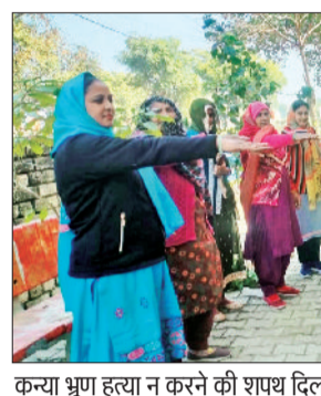
कन्या भूषण हत्या न करने की शपथ दिलाते स्वास्थ्यकर्मी।