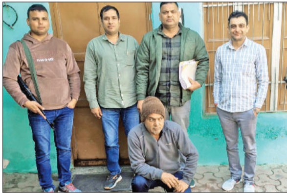
जींद। पुलिस गिरफ्त में आरोपित।