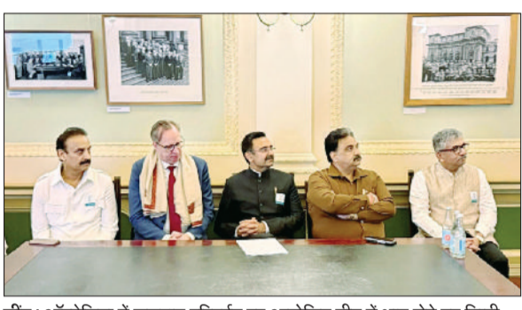
जीद। ऑस्ट्रेलिया में जलवायु परिवर्तन पर आयोजित मीट में भाग लेते हुए डिप्टी स्पीकर डा. कृष्ण मिड्डा।

■ जलवायु परिवर्तन, विधेयक निर्माण में एआई की भूमिका, जलवायु परिवर्तन विषयों पर चर्चा