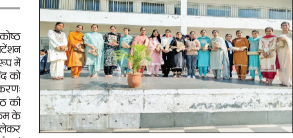
मिलेनियम वर्ल्ड स्कूल में छात्राओं को सम्मानित करते शिक्षकगण।